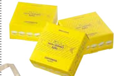
《青春アビージョー〜ハーブへしこのオイル煮〜》