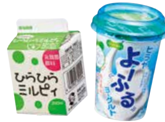
《ひらひらミルピィ・ヨーふるヨーグルト》