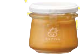
《ジャージーミルクジャム》