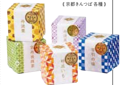
《京都きんつば各種》