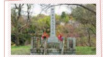
細川ガラシャの碑 細川典興に嫁いだ明智光秀の娘・玉は本能寺の変により逆臣の娘となり、居城のあった宮津から遠く離れた山深い地、味土野(みどの)に幽閉された。この時に従った侍女・清原マリアの影響でキリスト教に救いを求めるようになり、後に洗礼を受け「ガラシャ」の名を授かった。 弥栄町味土野 9