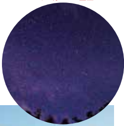
スイス村からの星空