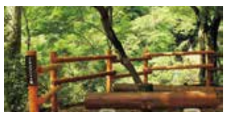
ガラシャ大滝展望所