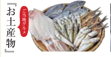
『お土産物』 地元産物