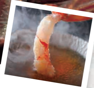
せくておろそと3ける カニシヤブは絶品!!

『幻のカニ』間人ガニ』 間人港のズワイカニ漁はわずか5隻の小型底曳網漁船で操業 しています。丹後半島沖約20km×30kmと漁場が近く日帰 り採集ができ鮮度が抜群。しかし、荒れる冬の日本海では漁に 出られる日が限られているため漁獲量が少なく、「幻のカニ」と も呼ばれています。水揚げされたカニは、漁師自らが船上で 約50段階もの選別基準により1匹1匹厳しくチェックされ、 「たいざがに」の文字と船名が刻印された緑のタグを付けられ たカニだけが最高級ブランド蟹として認められます。