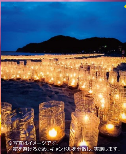
※写真はイメージです。 密を避けるため、キャンドルを分散し、実施します。