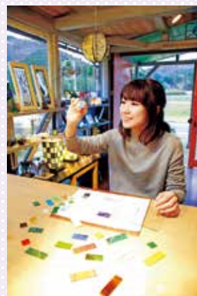
ガラス・スタジオ来夢 / ガラスづくり体験▲