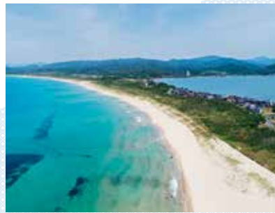
▲小天橋・葛野浜海水浴場から浜詰夕ヶ浦海水浴場まで約8km続く白砂のロングビーチ。