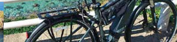
◀大成古墳群から海岸を見わたすと、神秘的な景色が広がる。