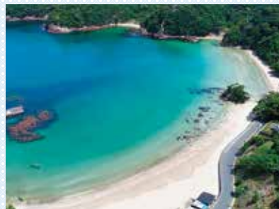
プライベートビーチのような雰囲気のビーチも。