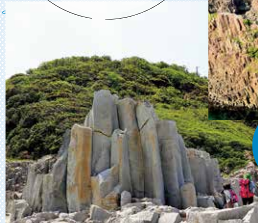
▲近畿最北端、経ヶ岬の先端は自然がつくり出した大きな石柱がそびえる。