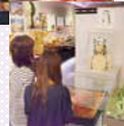
▲アミティ丹後 / 染色・手織