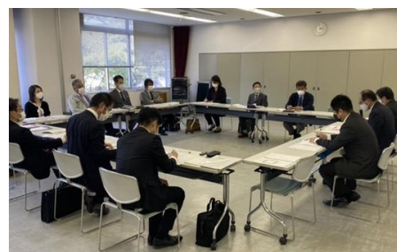
意見を交わす出席者ら