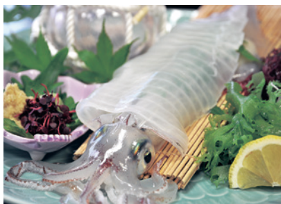
年中さまざまな種類がとれるイカ。秋はアオリイカが水揚げされます(写真はケンサキイカ)

「碓のかり(高原牧場)は標高約400mにあり、広々とした草原と青い海とのコントラストが美しい場所です。牧場に隣接しているのがステーキハウス。のどかなロケーションの中、ステーキやハンバーグなど食べ応えのある肉料理をどうぞ。