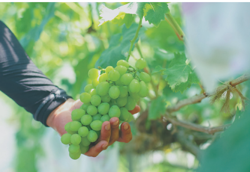
フルーツも京丹後市の名産。秋が旬のブドウは、1粒1粒甘みと酸味が絶妙に広がる。写真はシャインマスカット。