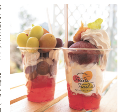
もぎたてのフルーツを楽しめるスイーツも人気

京都市内から車で約90分の京丹後市。海と山に囲まれ、自然豊かな美しい景色が広がります。春にはイチゴ、夏には桃、メロンといったように、とれたての旬のフルーツに出合えるのが魅力。秋にはブドウや梨が登場します。ブドウは多数の品種があるので、食べ比べるのもいいですね。