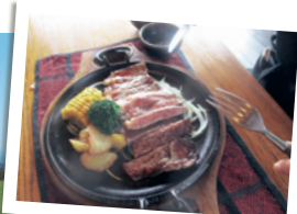
「碓高原ステーキハウス」で味わえる国産牛のステーキ