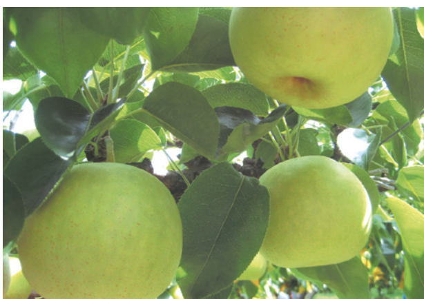
梨は果汁が多かったり、酸味が強かったりと、品種ごとの違いも楽しんで

「海の京都」のロゴマーク。京都府および北部7市町が連携して設立した「海の京都DMO」が観光都市づくりに取り組んでいます