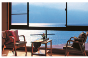
宿でのんびりくつろいで