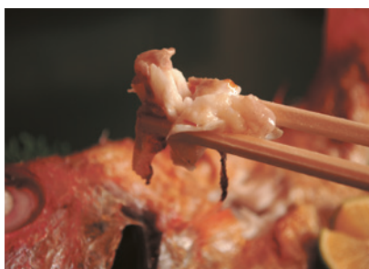
脂ののったノドグロ。ノドグロ料理づくめのコースを用意する店も

京丹後市のグルメに欠かせないのが海産物。水揚げされたばかりの海の幸を、市内の飲食店や宿で堪能できます。料理入が腕によりをかけた品が味わえます。これからの時期に旬を迎えるものの一つがノドグロ。やわらかい身は脂がのって、白身はトロトロといわれるほど。