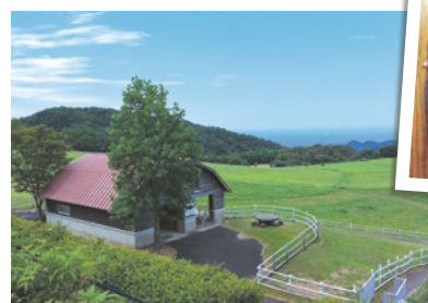
「碓高原牧場」ではヤギや羊、牛が放牧されています

「碓のかり(高原牧場)は標高約400mにあり、広々とした草原と青い海とのコントラストが美しい場所です。牧場に隣接しているのがステーキハウス。のどかなロケーションの中、ステーキやハンバーグなど食べ応えのある肉料理をどうぞ。