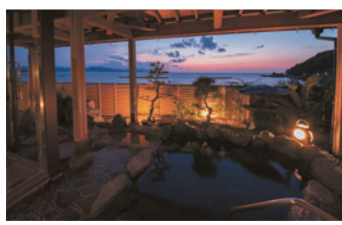
温泉でリフレッシュ