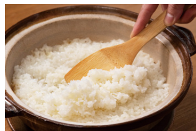
上品な甘みの丹後産コシヒカリ