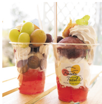
旬のフルーツを味わえるスムージー、パフェなども楽しみ

旬のフルーツも、京丹後市の魅力。秋といえば、甘酸っぱいブドウや、みずみずしい梨などです。網野町から久美浜町にかけての国道178号の両側には果樹園が点在。果物農家の直売所や道の駅などが並んでいます。「京丹後フルーツトレイル」に参加する直売所などでは、SNS映えするメニューがそろいますよ。サツマイモスイーツも人気です。