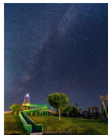
【秋】峰山途中ヶ丘公園