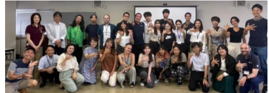
▲成果発表会(市役所)で記念撮影