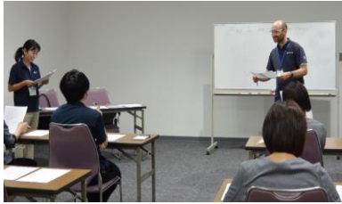
▲英会話講座(トライアル)の様子