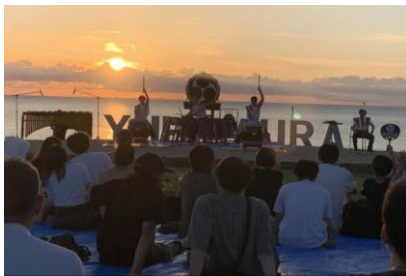
▲夕日の音楽会 フィナーレの様子

サンセットと同時にフィナーレを迎えると、観客も盛り上がり、夏の終わりの最高に熱い日となりました。