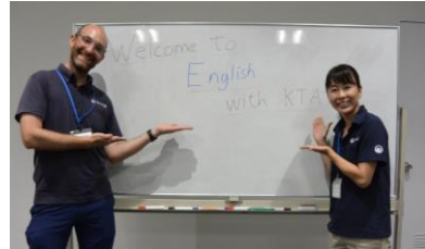
▲English with KTA