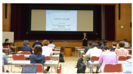
▲アテンダント講座の様子

今後も、「健康長寿のまち・京丹後」ならではの豊かな自然や食材を活かしたヘルスツーリズムを展開していきます。