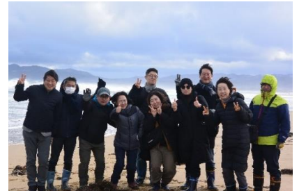
▲韓国FAMツアーの様子

ウンド受け入れ可能な宿泊施設のタリフ作成については、「海の京都DMO2019ホテル情報」のリサーチを基にインバウンド受け入れ可能施設を選定し、宿泊施設にメールにて協力要請を行うものです。