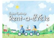
▲ポケットに収まるサイズのマップ

進みます。関西圏にある空港、サービスエリア、案内所などに配架し、京丹後をPRします。