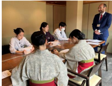
▲接客対応英会話出張講座の様子