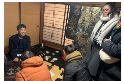
▲ヨーロッパFAMツアーの様子