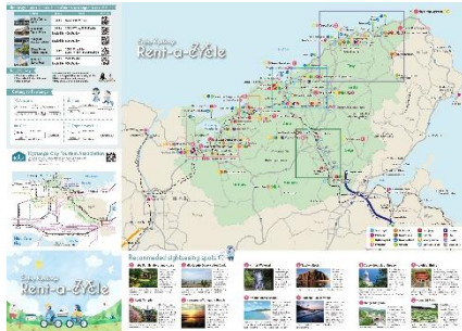
▲サイクリングマップ【表面】