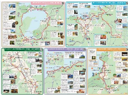
▲サイクリングマップ【中面】