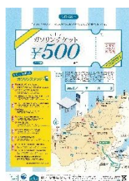
②ガソリンチケット