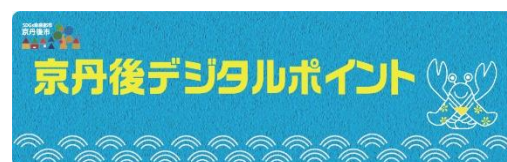
③デジタルポイント